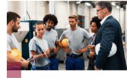
Einführung von KI-Systemen in Unternehmen Gestaltungsansätze für das Change-Management